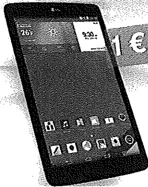
TABLET LG G PAD 8.0 LTE

Predĺžte si zmluvu s paušalom Happy Profi a novým akciovým tabletom. 4G smartfón od nás dostanete ako darček. Zistíte viac na www.telekom.sk