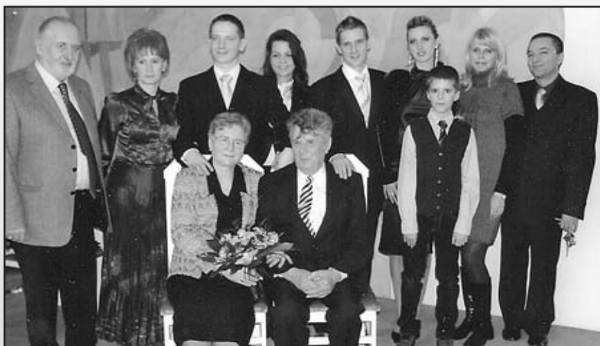
Jubilujúci manželský pár v kruhu svojej rodiny - A jubiláló házaspár családi körben

dal ezelőtt tett házastársi fogadalmukat ünnepélyes keretek között felújították, és aláírásaikkal a község emlékkönyvében