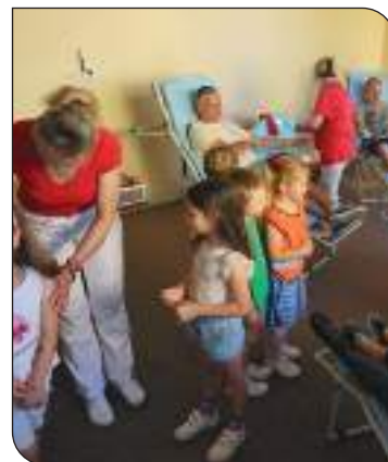
Júnový odber krvi navštívili aj malí škôlkari A júniusi véradásra ellátogattak a kis óvisok is

Poriadková služba obce – 0910 97 97 97 – A község rendfenntartó egysége