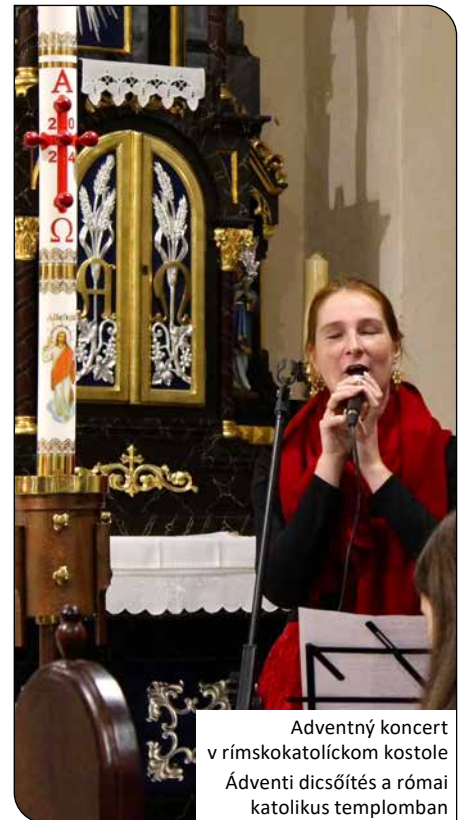
Adventný koncert v rímskokatolíckom kostole Ádventi discsótés a római katolikus templomban

Ďalšie fotky z podujatí nájdete na stranách 27. a 28.