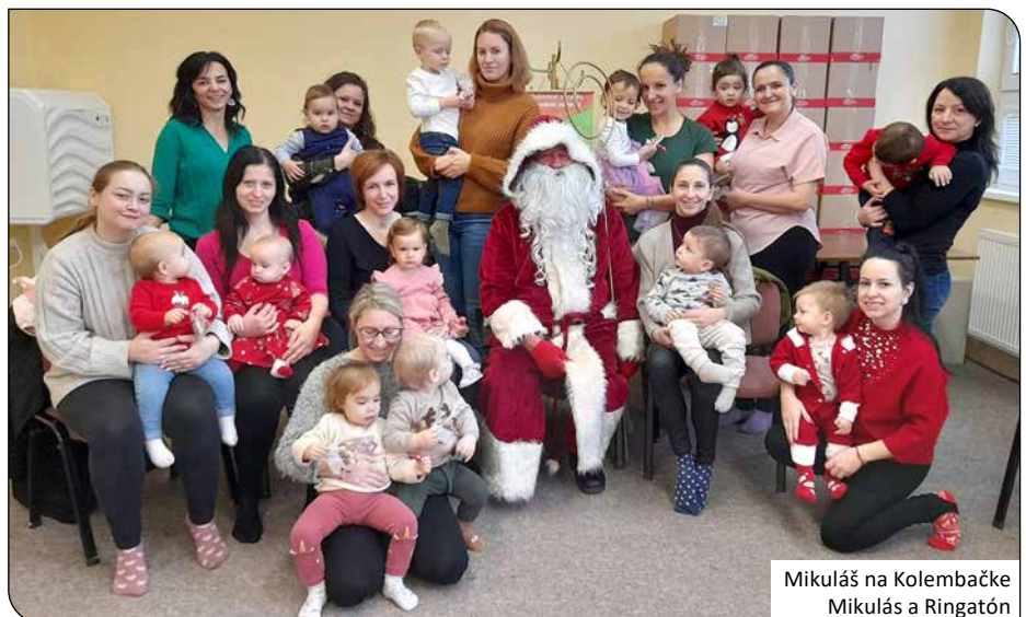
Mikuláš na Kolembačke Mikulás a Ringatón