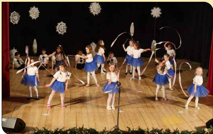
Vianočný program Materskej školy slovenskej - A szlovák óvoda karácsonyi műsora