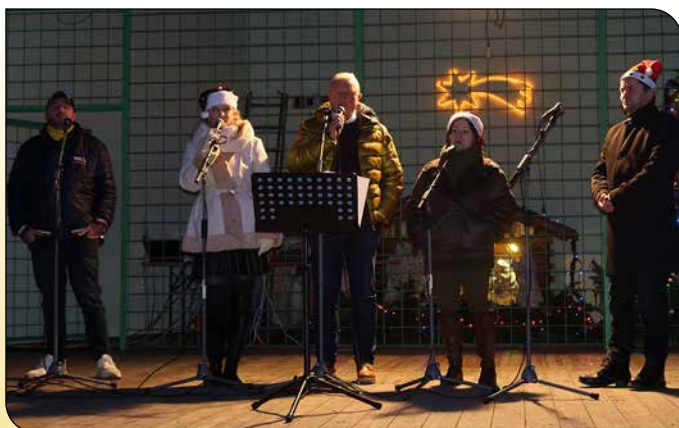
Vianočné stretnutie občanov - Karácsonyi forgatag