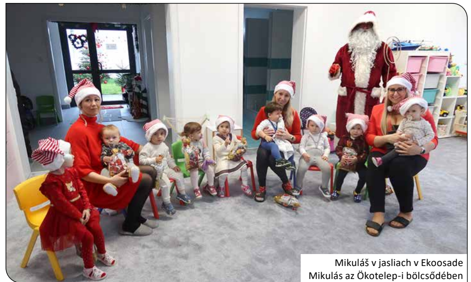
Mikuláš v jasliach v Ekoosade Mikulás az Ökotelep-i bölcsődében