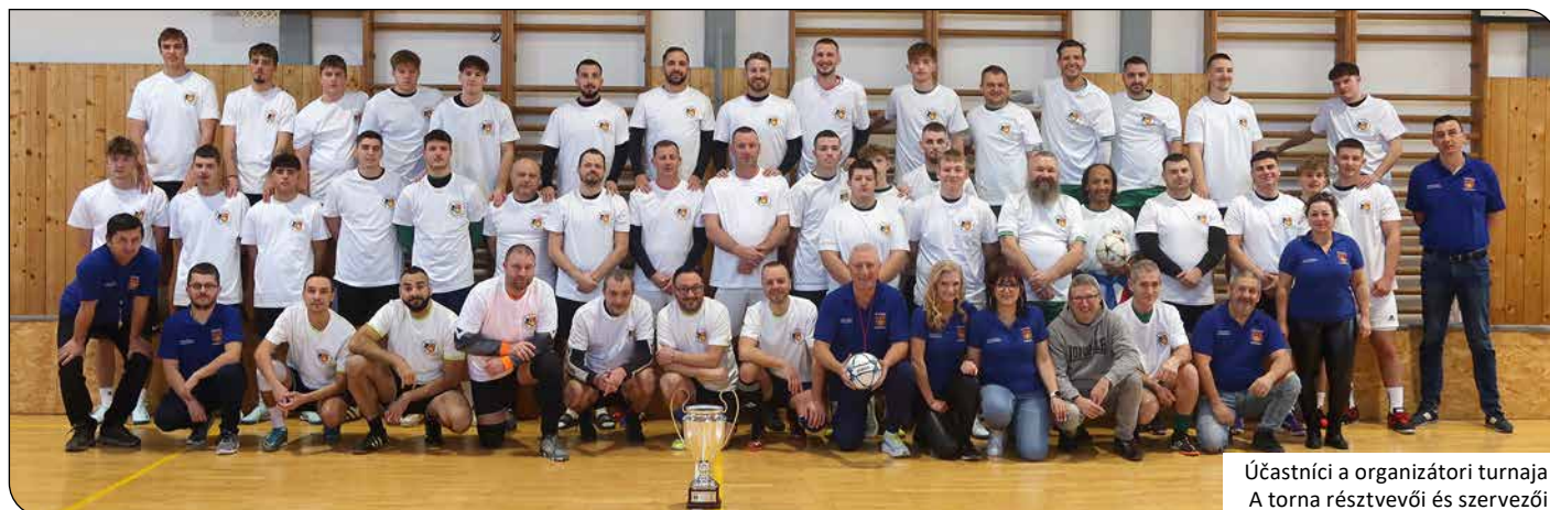
Účastníci a organizátori turnaja A torna résztvevői és szervezői