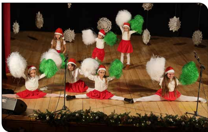
Vianočný program ZŠ Mihálya Borsosa s VJM - A Borsos Mihály Alapiskola karácsonyi műsora