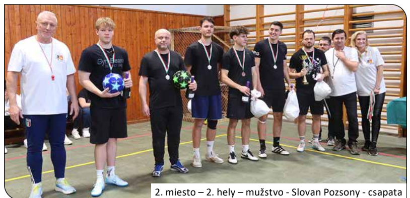
2. miesto – 2. hely – mužstvo - Slovan Pozsony - csapata