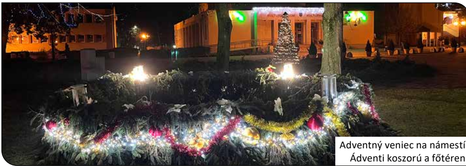
Adventný veniec na námestí Ádventi koszorú a fótéren

Mesiac december 2024 bol v našej obci naozaj bohatý na kultúrno-spoločenské podujatia. Hneď 1. decembra bola zapálená prvá sviečka na veľkých adventných vencoch pri rímskokatolíckom kostole a na námestí obce. V tento deň sa otvorilo aj prvé okno živého adventného kalendára. Do tohto krásneho podujatia, ktoré prispelo k formovaniu komunity sa aj v tomto roku nezištne zapojilo 23 rodín v obci a Miestne kultúrne stredisko, ktoré návštevníkov často vítali aj bohatým občerstvením. Za ich nezištnú podporu aj touto cestou veľmi pekne ďakujeme.