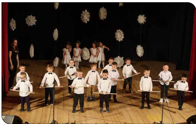
Vianočný program MŠ Rozprávková krajina s VJM - A Meseország óvoda karácsonyi műsora