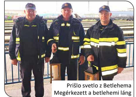
Přišlo svetlo z Betlehema Megérkezett a betlehemi láng