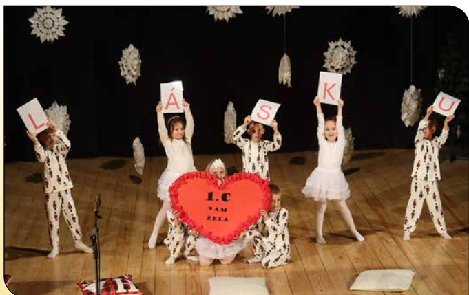
Vianočný program ZŠ Mikuláša Lieskovského - A Mikuláš Lieskovský Alapiskola karácsonyi műsora