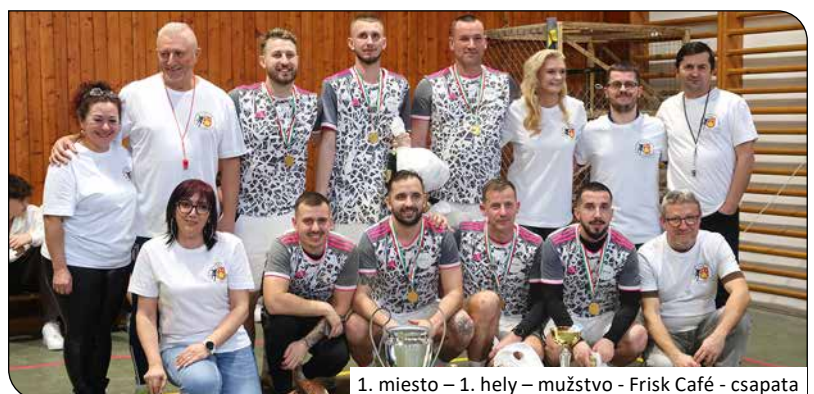
1. miesto – 1. hely – mužstvo - Frisk Café - csapata