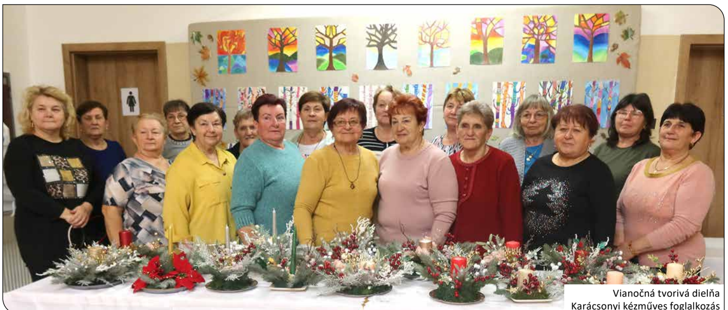
Vianočná tvorivá dielňa Karácsonyi kézműves foglalkozás