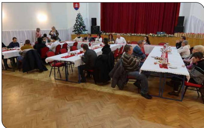
Posedenie s občanmi so ZŤP Találkozó a fogyatékkal élő polgártársakkal