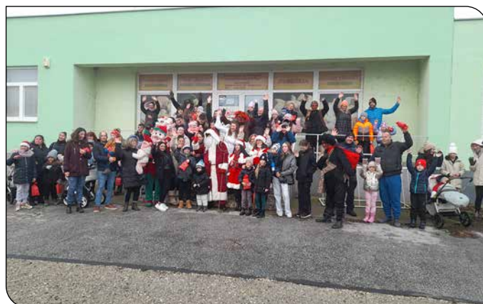
Obecný Mikuláš - Községi Mikulás