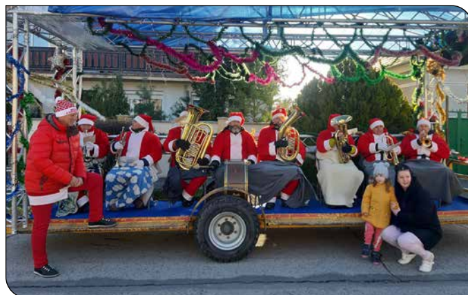
Dychový súbor Veľkouľančanka A Veľkouľančanka fúvószenekar